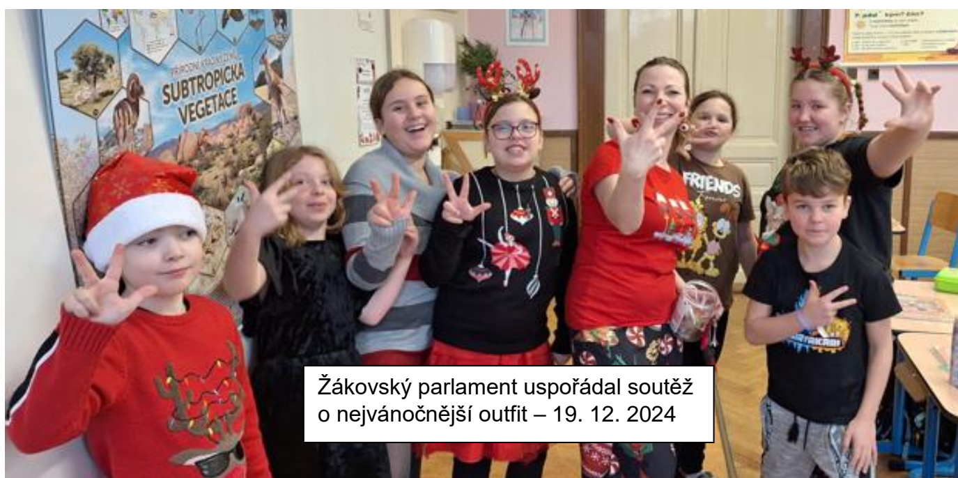
Žákovský parlament uspořádal soutěž o nejvánočnější outfit – 19. 12. 2024