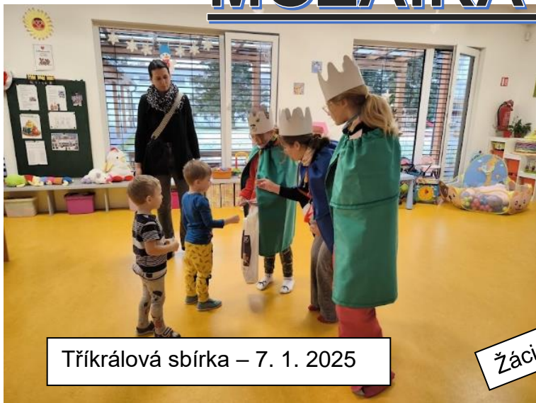
Tříkrálová sbírka – 7. 1. 2025