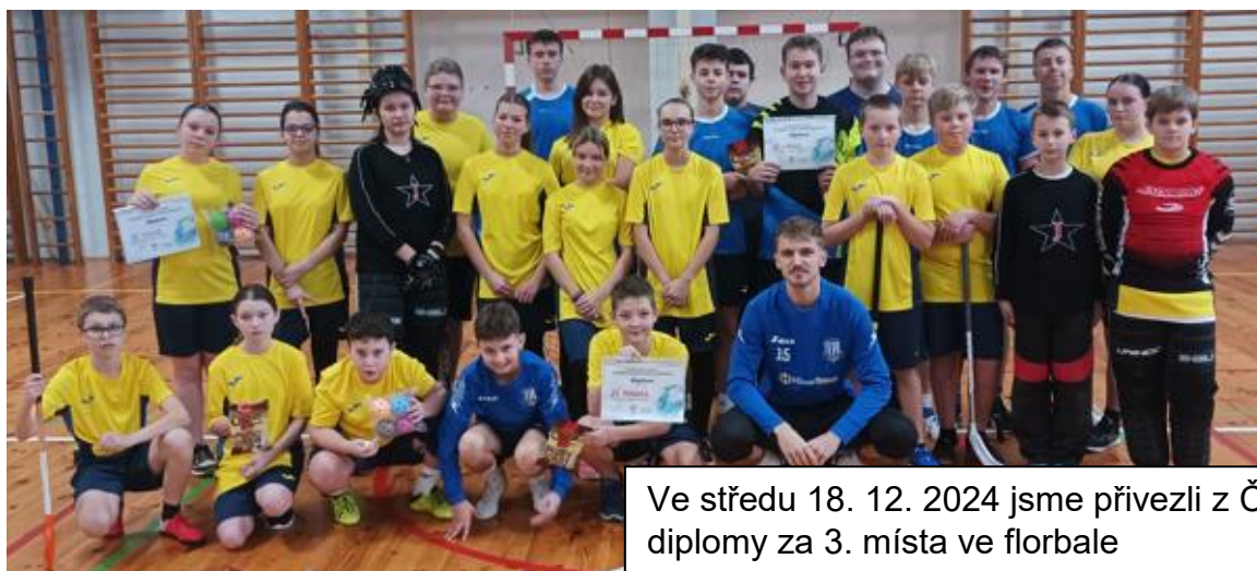
Ve středu 18. 12. 2024 jsme přivezli z Čimelic diplomy za 3. místa ve florbale