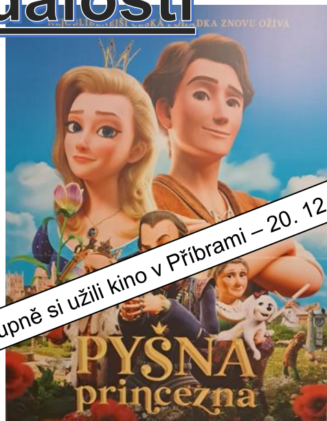
Žáci z 1. stupně si užili kino v Příbrami – 20. 12. 2024