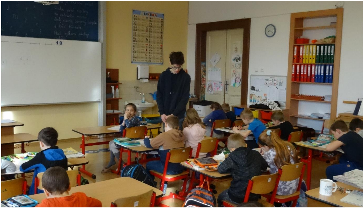
Den naruby – 27. 3. 2024