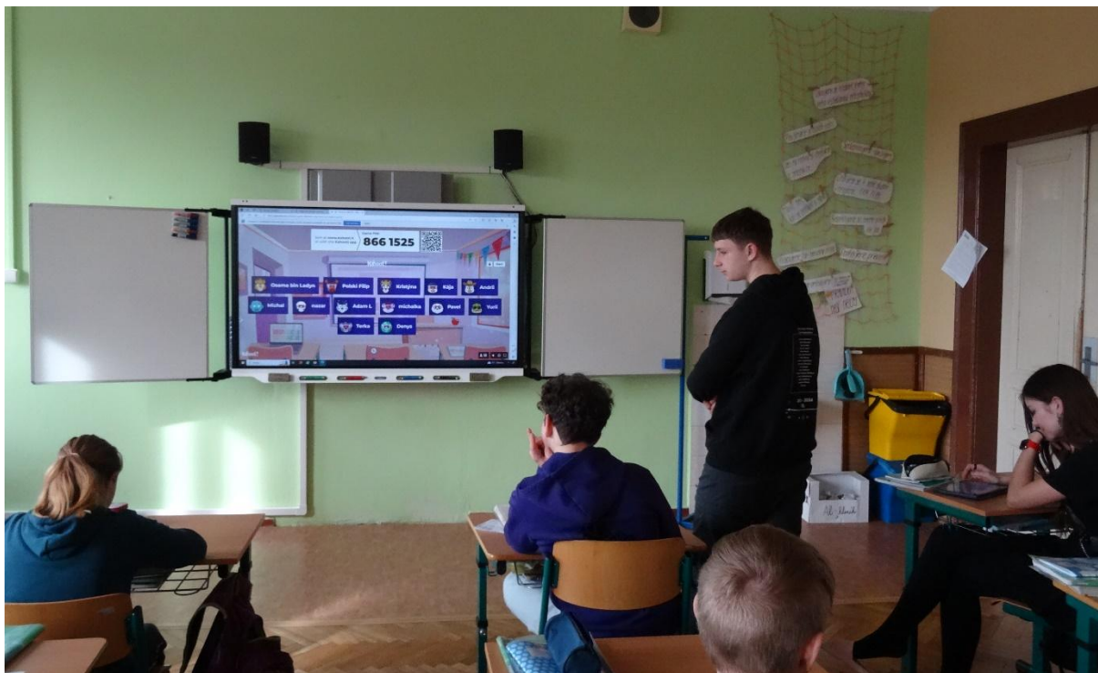
Den naruby – 27. 3. 2024