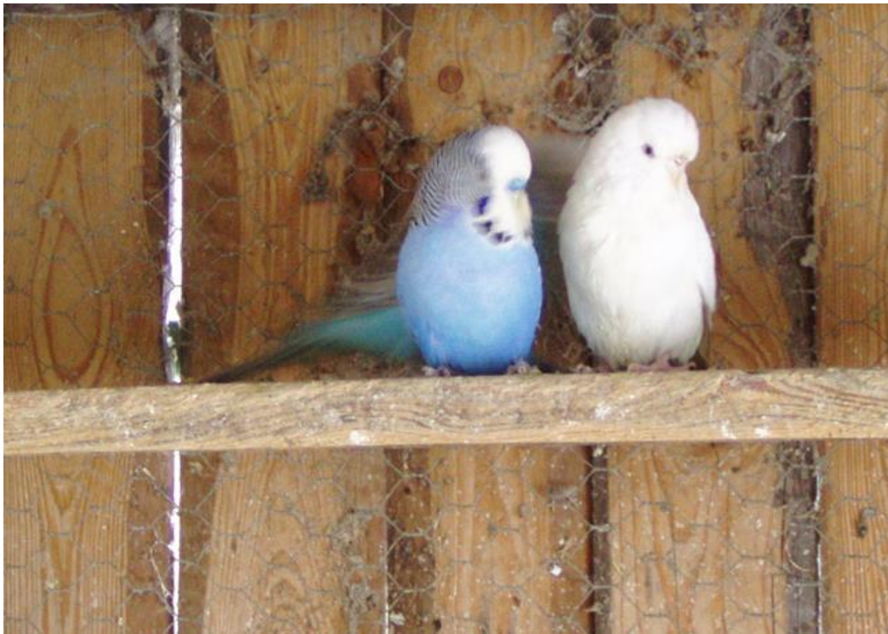
Papoušek vlnkovaný (andulka)