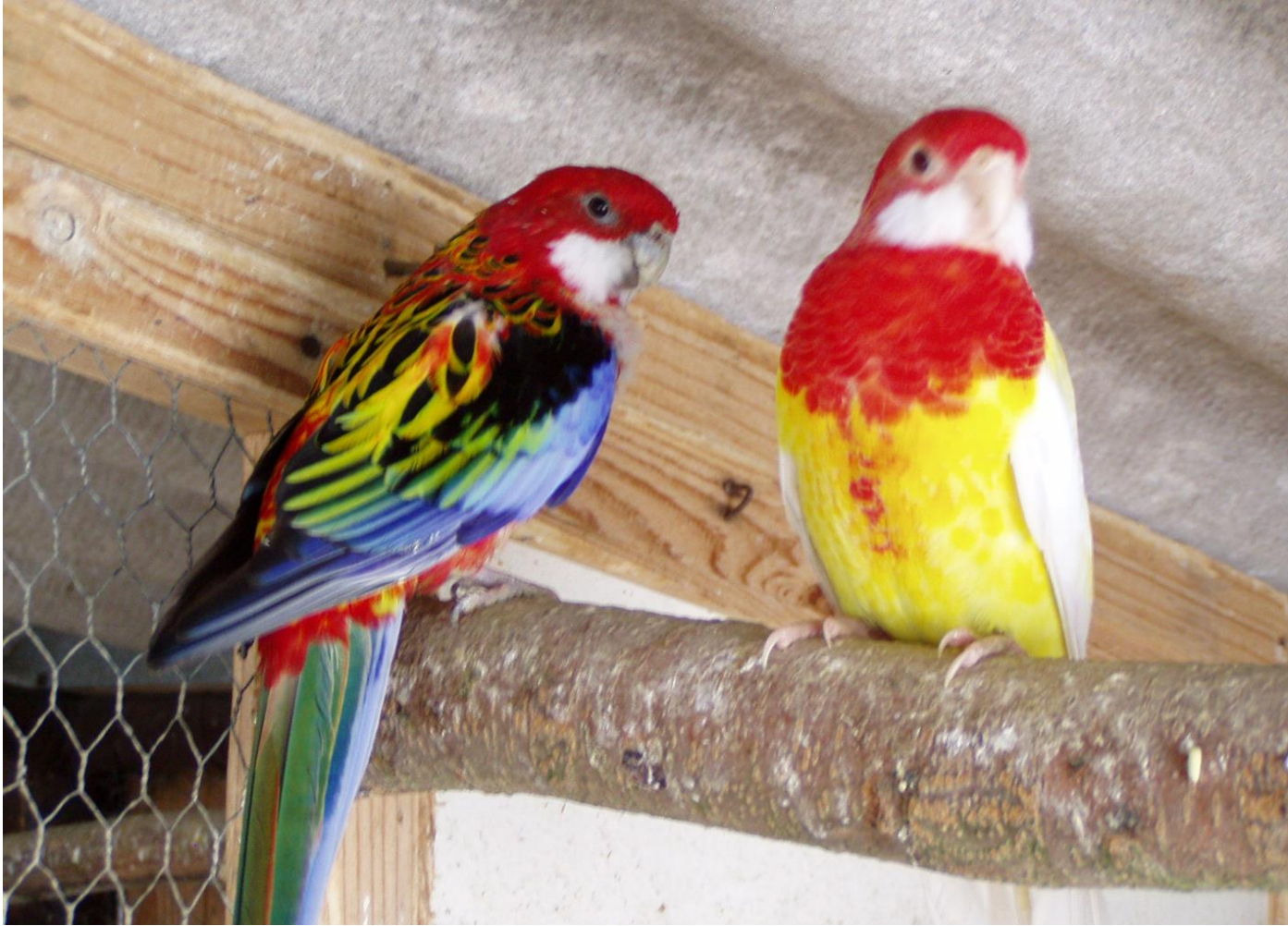
Rosela pestrá a rosela pestrá lutino