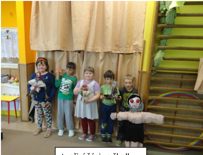
tvořiví žáci ze školky