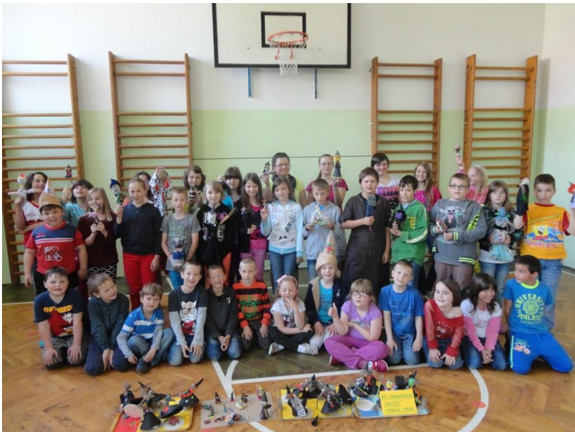
„Tvořílkové“ ze základní školy – nakonec jich bylo dost. Práce se všem povedla – všem patří velká pochvala.