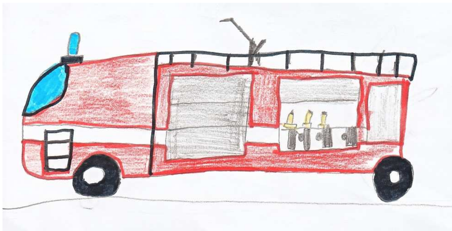
Vojtěch Košťál, III. třída

V úterý 8. 10. jsme jeli na výlet do Prahy, do Poslanecké sněmovny a na Letiště Vodochody. V Poslanecké sněmovně se mi líbil pozlacený strop. A na letišti zase stíhačka. A celý výlet byl moc pěkný.