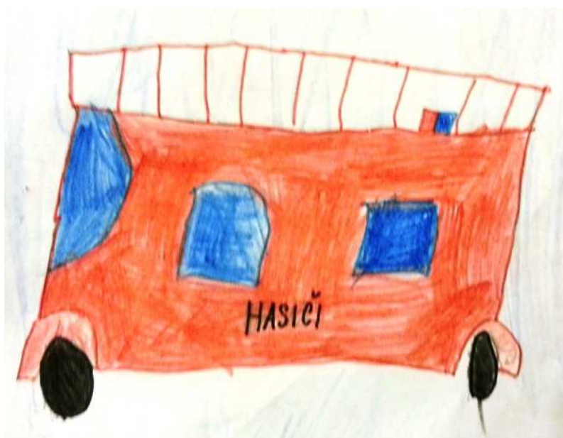
Petra Vejšická, IV. třída

Dne 8. 10. 2013 jsme jeli do Prahy. V Praze jsme byli v Poslanecké sněmovně a na letišti ve Vodochodech. Viděli jsme požárníky, letadla a sokolníky. Všem se nám to líbilo.