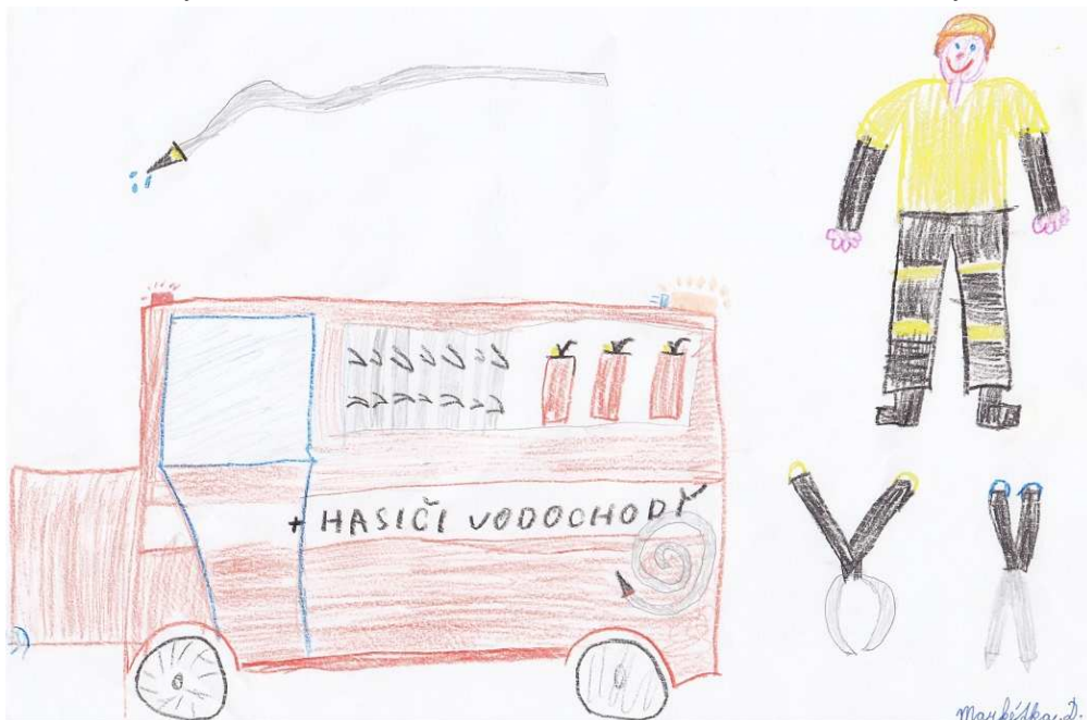
Markéta Dubská, III. třída

Nejvíce se mi líbilo v Poslanecké sněmovně. Byly tam krásně pozlacené stropy a velmi mě zaujaly křišťálové lustry. Na letišti se mi zalíbili hasiči, kteří měli elektrické nůžky a kleště na vyprošťování.